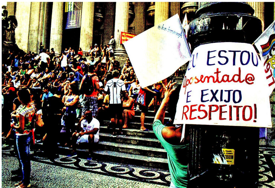
FALTOU CAIXA Protesto de servidores no Rio: disparada nos gastos com o funcionalismo público e com os inativos